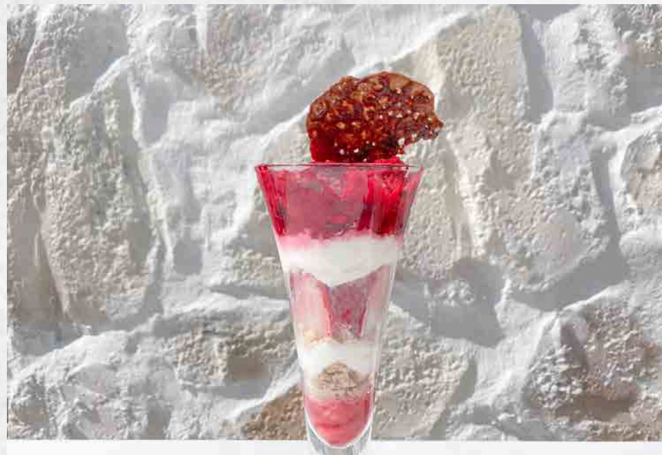
季節のパフェ 1080(1188) MINI 780(858)