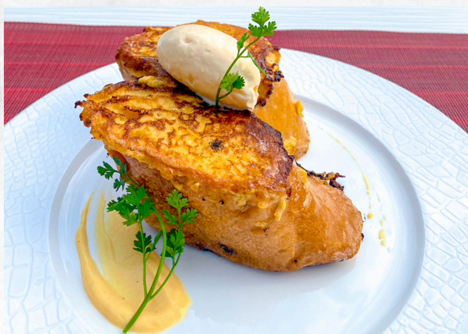
フレンチトースト 500(550)