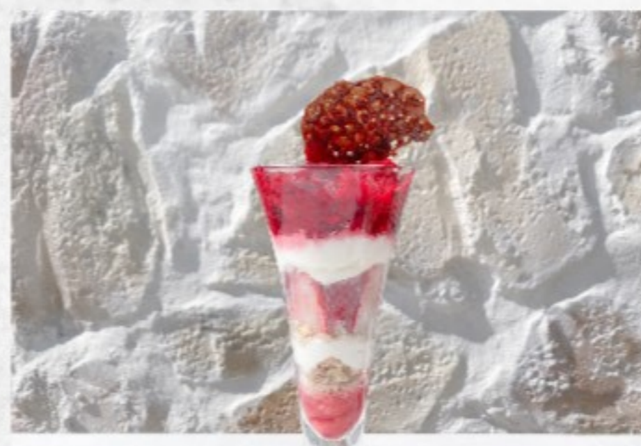
季節のパフェ 780(858) MINI 500(550)