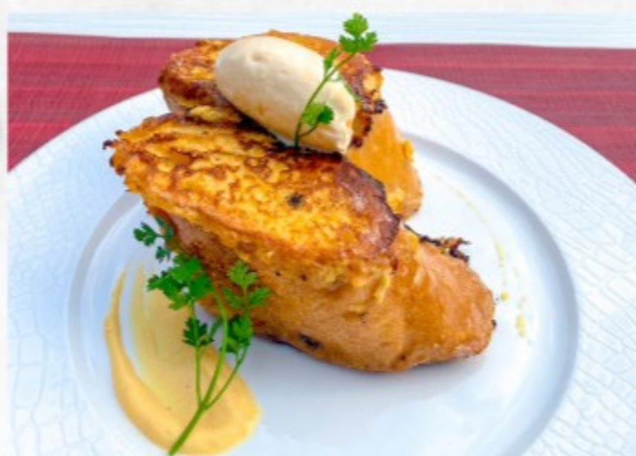
フレンチトースト 500(550)